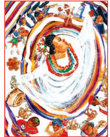
Artista: Nora Chapa Mendoza