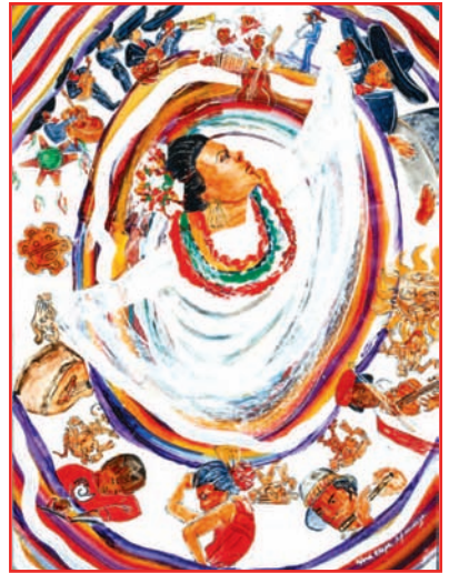
Artist: Nora Chapa Mendoza